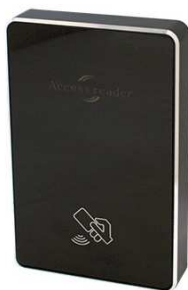
AR100-EH black / AR101-MF black