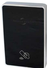
AR100-EH silver / AR101-MF silver